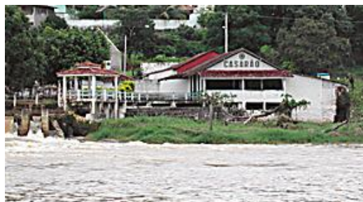
Nome do atrativo: Escadaria Jamilli Daher Rocha

MURARI, Jonas Braz et al. História, Geografia e Organização Social e Política do município de Nova Venécia. Vitória: Brasília, 1992.